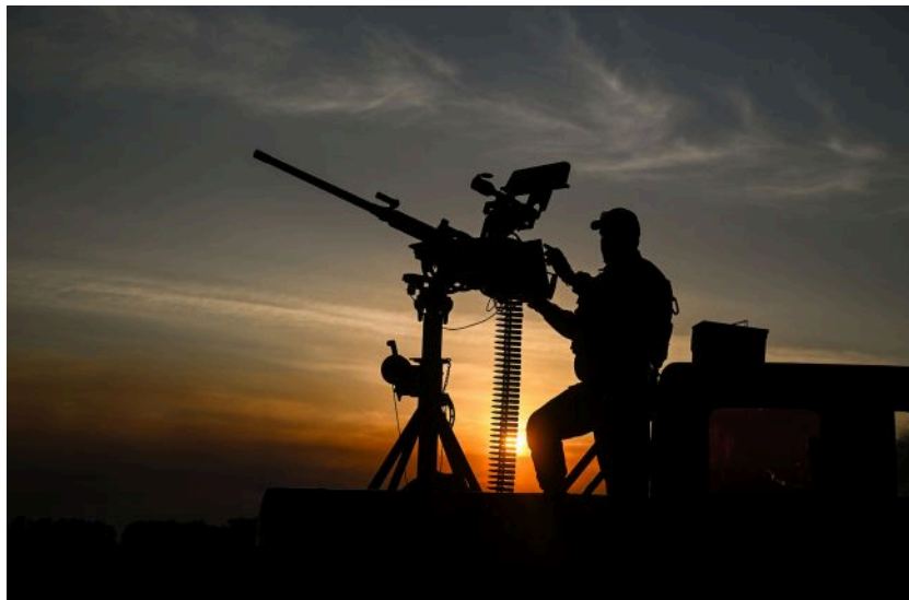
Фото: у Генштабі пояснили, як відпрацювала українська ППО (Getty Images)

Обирайте перевірене - додайте РБК-Україна до улюблених джерел у Google