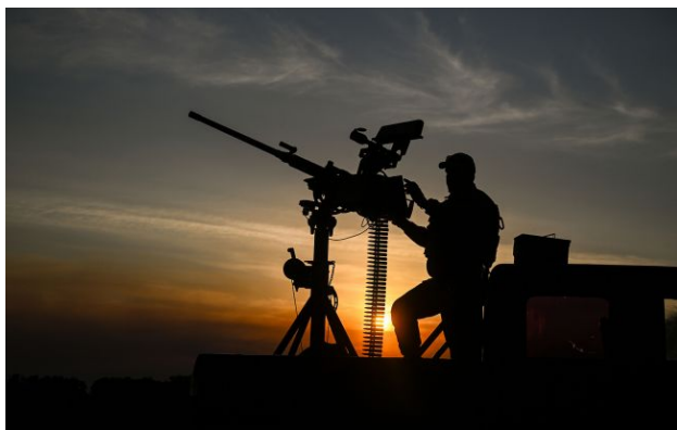
Фото: у Генштабі пояснили, як відпрацювала українська ППО (Getty Images)

Обирайте перевірене - додайте РБК-Україна до улюблених джерел у Google