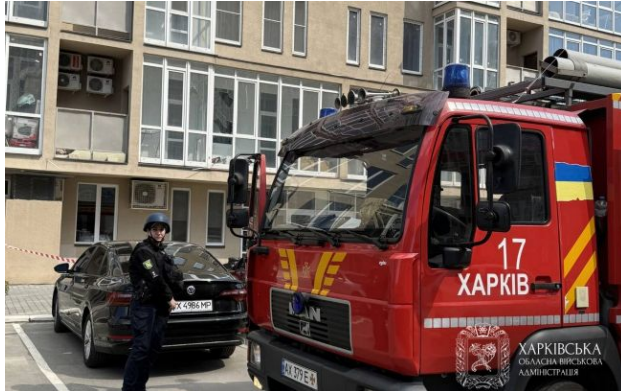
Фото: наслідки атаки дронів на Харків

Обирайте перевірене - додайте РБК-Україна до улюблених джерел у Google