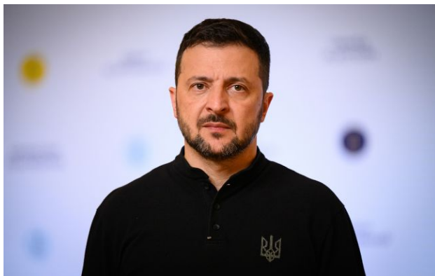
Фото: Володимир Зеленський (Getty Images)

Обирайте перевірене - додайте РБК-Україна до улюблених джерел у Google