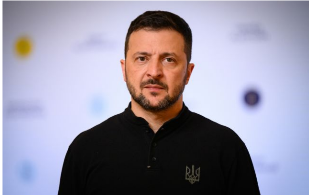
Фото: Володимир Зеленський (Getty Images)

Обирайте перевірене - додайте РБК-Україна до улюблених джерел у Google