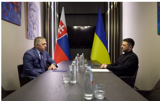
Фото: прем'єр Словаччини Роберт Фіцо та президент України Володимир Зеленський (president.gov.ua)

Обирайте перевірене - додайте РБК-Україна до улюблених джерел у Google