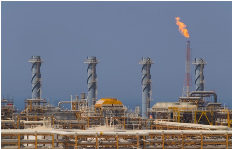
Вид на частину 19-ї фази газового родовища Південний Парс в Ассалуї

Напередодні відбулися великі атаки по ключових газових об'єктах Ірану та Катару. Ціна на газ в Європі зросла одразу на 35%.