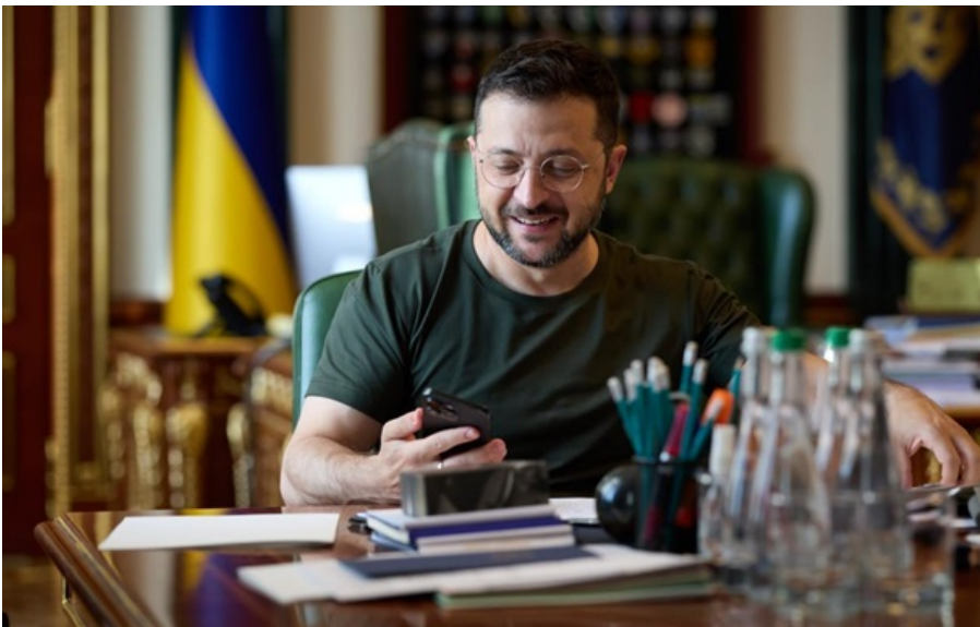
Володимир Зеленський поговорив з Робертом Фіцо 2 травня

Словаччина підтримує членство України у Євросоюзі та готова ділитися своїм досвідом вступу, зазначив президент.