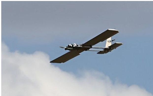
Фото: Сили оборони ударили по заводу дронів "Молнія" у Таганрозі (росЗМІ)

Сили оборони України завдали ракетного удару по Таганрогу Ростовської області РФ. Уражено підприємство ОПК "Атлант Аеро", яке виробляє дрони "Молнія" та комплектуючі до безпілотників "Оріон".