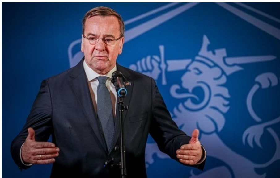
Борис Пісторіус очікував на таке рішення США

📄 0 🐦 0 🗨️ 0 👁️ 9 ЧИТАТИ НОВИНУ РОСІЙСЬКОЮ