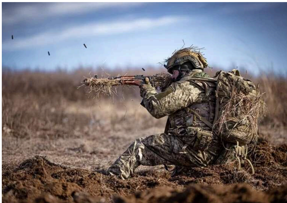
Битва за Покровськ: РФ накопичує бронетехніку для прориву до Шевченкового, ДШВ координують оборону міста

Російська армія продовжує нарощувати присутність піхоти, бронетехніки та танків у південній частині Покровська на Донеччині, щоб просунути у напрямку Шевченкового. Командир 7 корпусу ДШВ синхронізував план оборонної операції Покровська підрозділами ЗСУ.