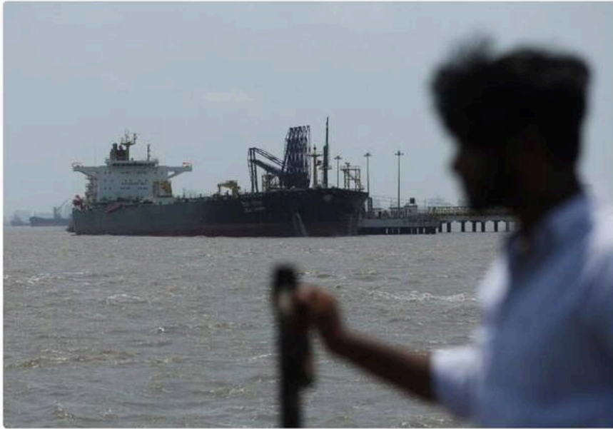
A man looks at the India-flagged tanker Dush Garima, as it unloads crude oil at an offloading terminal after transiting the Strait of Hormuz, amid supply disruptions linked to the U.S.-Israeli conflict with Iran, in Mumbai, India, April 30, 2026.

Теги: Иран Иран США морская блокада блокада Ормузский пролив