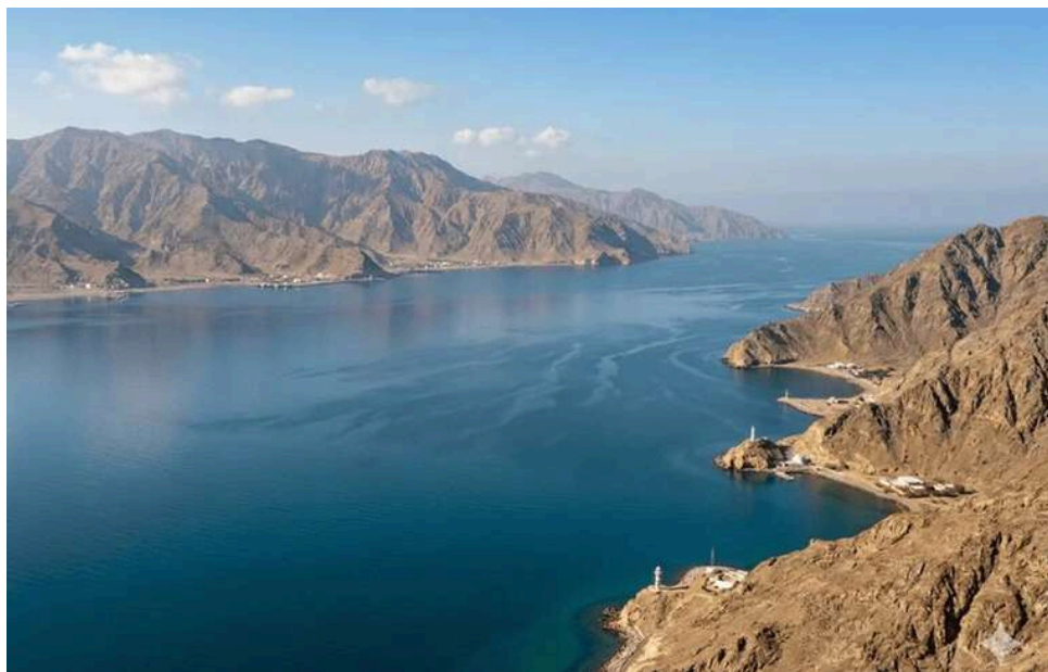
Блокада Ормузької протоки загрожує різким погіршенням ситуації на нафтовому ринку, – CNN

Наслідки блокади Ормузької протоки для світового нафтового ринку найближчим часом можуть різко погіршитися.