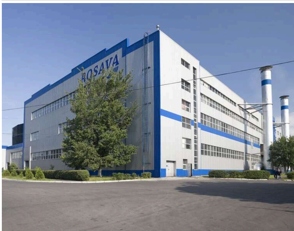
«Звільнили за добу»: у Білій Церкві без роботи залишилися 1200 працівників заводу «Росава»

У Білій Церкві за добу звільнили приблизно 1200 співробітників: єдиний в Україні шинний завод – Росава – поступово припиняє роботу.