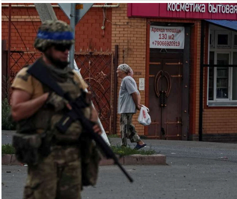
Квиток в один бік: чому українці повертаються в окупацію попри ризики та фільтрацію

Попри небезпеки та значні витрати, деякі українці все ж повертаються на тимчасово окуповані території.