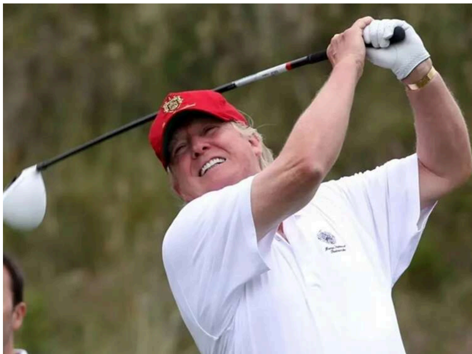
Гольф на тлі кризи: Трамп поїхав до клубу після наради про закриття Іраном Ормузької протоки

Президент Сполучених Штатів Дональд Трамп покинув Білий дім, щоб пограти в гольф, у той час як ситуація довкола Ормузької протоки загострюється: Іран вдруге закрив її у відповідь на морську блокаду американцями іранських портів.