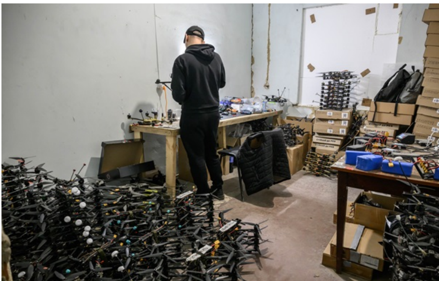
Україні обіцяють допомоги з дронами

Держави-члени НАТО протягом 2026 року нададуть Україні військової підтримки на суму 60 млрд доларів, причому ця цифра не включає кошти, що надійдуть українській армії з 90 млрд євро кредиту від Європейського Союзу.