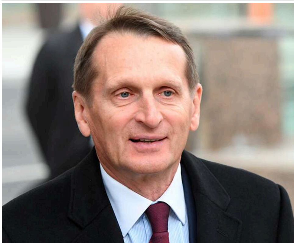
Нарішкін пророкує Європі "політичне цунами" та звинувачує Польщу та країни Балтії у мілітаризації

Сергій Нарішкін повідомив про посилення напруженості на кордонах Росії та Білорусі, а також застеріг Європу від майбутнього «політичного цунамі».