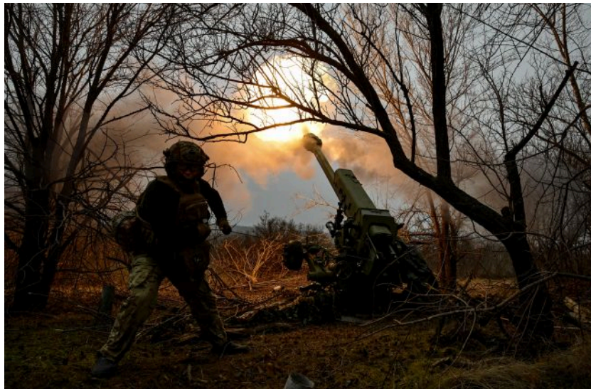
Фото: росіяни намагаються витіснити Сили оборони з північних околиць Покровська