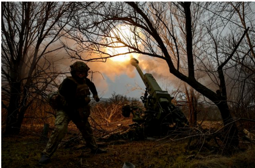
Фото: росіяни намагаються витіснити Сили оборони з північних околиць Покровська