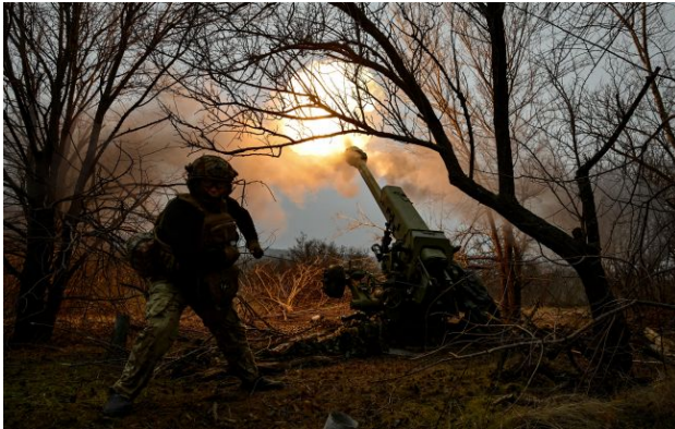
Фото: росіяни намагаються витіснити Сили оборони з північних околиць Покровська

Обирайте перевірене - додайте РБК-Україна до улюблених джерел у Google