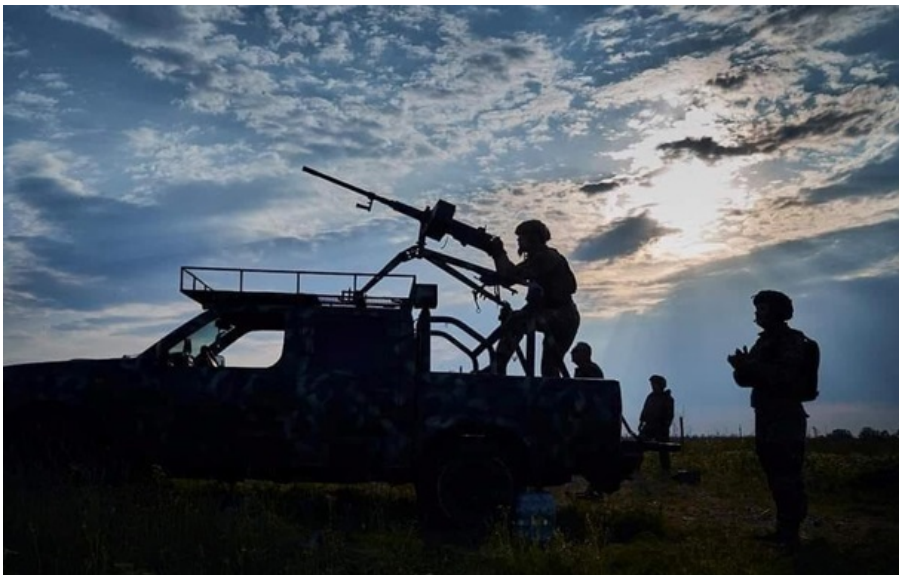
Фото: facebook.com/PvKPivden (ілюстративне фото) ППО збила або подавила 349 БПЛА

Удень було зафіксовано влучання однієї ракети та 12 БПЛА на 6 локаціях, а також падіння уламків на 12 локаціях.