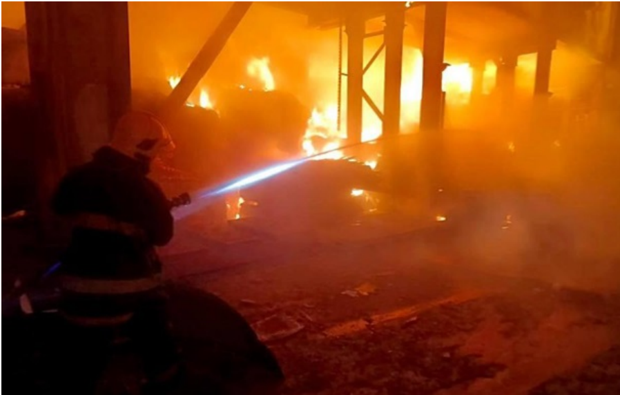
Наслідки атаки

Після "прильоту" сталася пожежа у виробничо-складській будівлі підприємства під Білою Церквою.