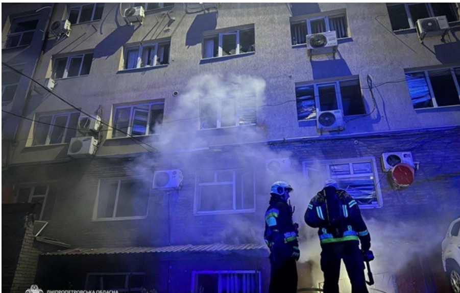
Росіяни вдарили по Дніпру

Внаслідок атаки сталося займання на території навчального закладу. Також горіли й офісна будівля та гараж. Понівечені автівки.