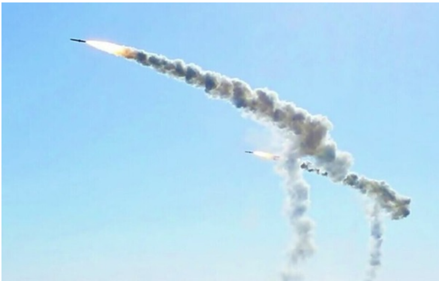
Росія атакувала Україну ввечері 15 квітня