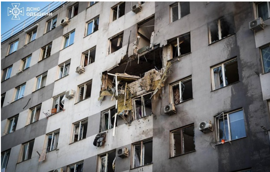
Росіяни влучили по багатоповерхівці в Одесі

Постраждали шестеро людей віком від 20 до 67 років. Чоловік віком близько 60 років - загинув.