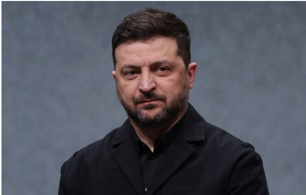
Фото: президент України Володимир Зеленський

Обирайте перевірене - додайте РБК-Україна до улюблених джерел у Google