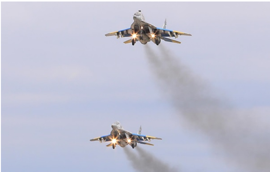
Українські винищувачі МіГ-29

Найбільш гарячим залишається Покровський напрямок, де ЗСУ зупинили 37 ворожих штурмів в районах 14 населених пунктів.