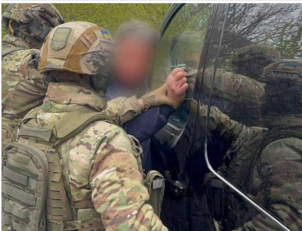
15 років сексуального терору під маскою доброчинності: у Вінниці затримали засновника дитячого реабцентру

У Вінниці затримали засновника християнського реабілітаційного центру, який протягом 15 років вчиняв сексуальне насильство над дітьми.