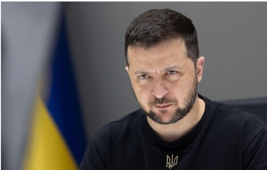
Фото: Офіс президента Президент України Володимир Зеленський

Союзники оголосили про нові пакети підтримки, зокрема у сфері ППО, дронів та логістики, а також підтвердили внески до спільних оборонних програм.