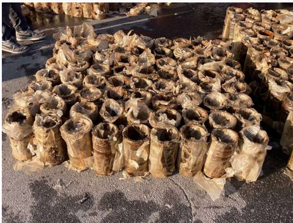
Військовий експорт під виглядом запчастин: хмельницькі митники викрили схему незаконного вивезення спецобладнання

Митники Хмельницької митниці зупинили спробу незаконного вивезення товарів подвійного призначення.