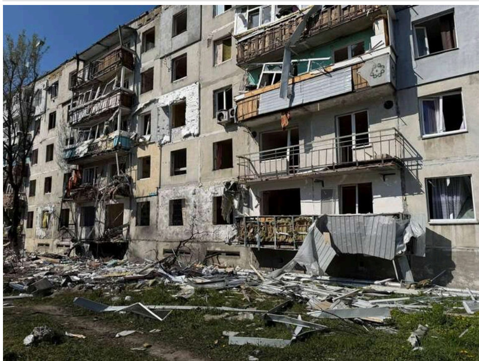
У Павлограді вночі зафіксовано удар дронів: пошкоджено житлові будинки та авто