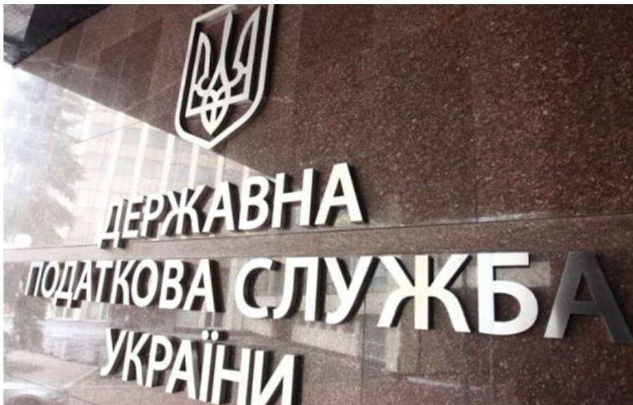
Фото: finclub (ілюстративне фото)

Українці сплатили майже 3 млрд грн податку на нерухомість у першому кварталі