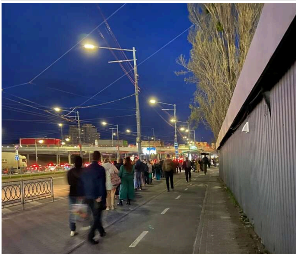
Транспортний колапс у Києві: через затяжну тривогу на зупинках до лівого берега зібралися величезні черги

У Києві вишикувалися величезні черги на маршрутки в бік лівого берега.