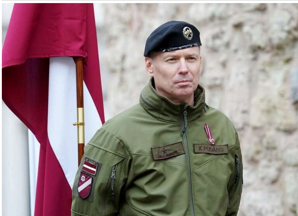
Командувач ЗС Латвії: Замороження війни в Україні дозволить Кремлю перекинути сили до кордонів НАТО

Командувач Збройних сил Латвії, генерал-майор Каспарс Пуданс заявив, що в Росії може існувати тимчасове «вікно можливостей» для можливої агресії проти країн НАТО до кінця десятиліття. За його оцінкою, ключовим фактором стане завершення або замороження бойових дій в Україні.