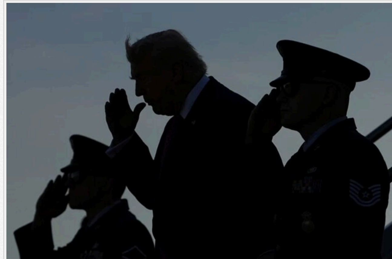
President Trump saluted as he exited Air Force One in Charlottesville, Va., on April 10.

Зокрема, загроза "знищення цивілізації" Ірану. Джерела уточнюють, що ця загроза не фігурувала в затверженому плані й стала імпровізацією Трампа, спрямованою на залучення Тегерана та прискорення переговорного процесу.