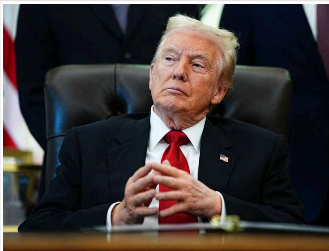
«Привид Джиммі Картера» та страх втрат: В WSJ розкрили причини відмови Трампа від захоплення іранського острова Харк

Трамп відкинув план захоплення острова Харк – важливого вузла експорту іранської нафти – через побоювання значних втрат, заявивши, що американські військові ризикують стати "легкою мішенню". Крім того, в оточенні Трампа війна з Іраном дедалі частіше сприймається як політично небезпечна, і міцнішає думка про необхідність її якнайшвидшого завершення, пише WSJ з посиланням на джерела.