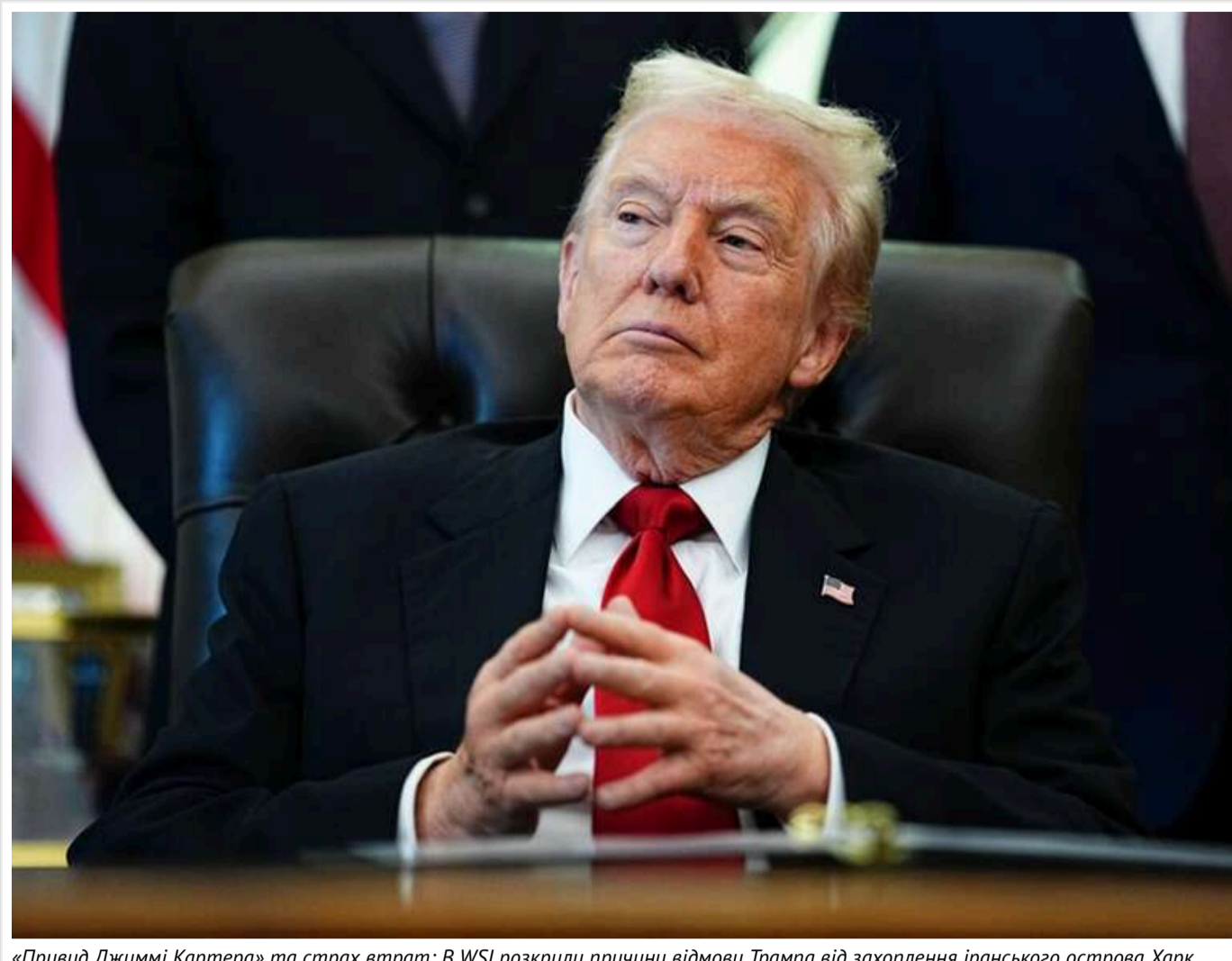
«Привид Джиммі Картера» та страх втрат: В WSJ розкрили причини відмови Трампа від захоплення іранського острова Харк

Трам відкинув план захоплення острова Харк – важливого вузла експорту іранської нафти – через побоювання значних втрат, заявивши, що американські військові ризикують стати "легкою мішенню". Крім того, в оточенні Трампа війна з Іраном дедалі частіше сприймається як політично небезпечна, і міцнішає думка про необхідність її якнайшвидшого завершення, пише WSJ з посиланням на джерела.