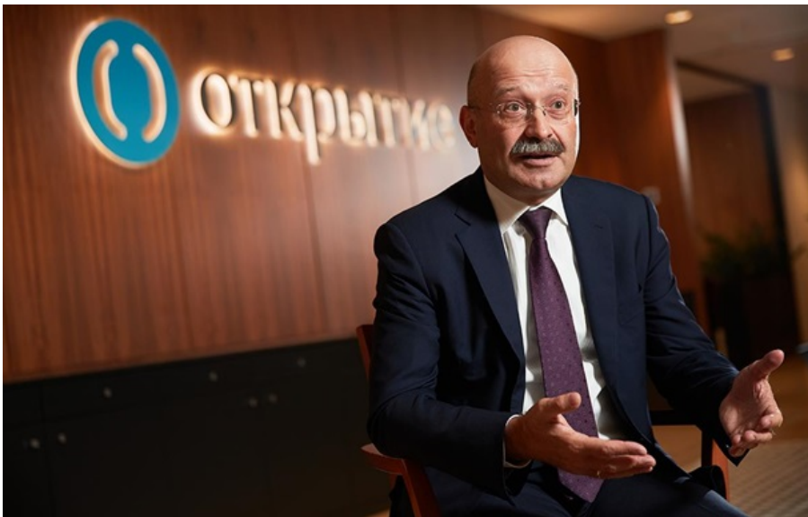
С Михаила Задорнова сняли санкции

Теперь американские активы Михаила Задорнова будут разблокированы, а американские контрагенты смогут проводить с ним финансовые операции.