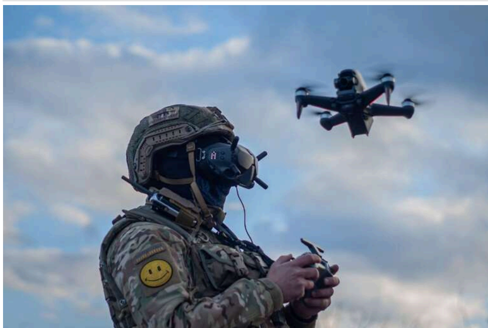
Дрони плюс піхота: Міноборони впроваджує єдину систему управління безпілотними та штурмовими групами

Впровадження дровоно-штурмових підрозділів, що поєднують безпілотні системи з піхотою, дозволило значно ефективніше звільняти території на півдні України.