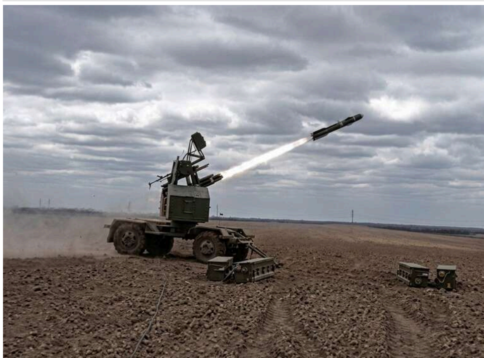
Полювання на «Шахедів»: Повітряні сили вперше показали бойову роботу секретного ЗРК STASH

1 травня ЗС РФ масовано атакували ударними дронами західні регіони України, зокрема Тернопіль і Рівне.