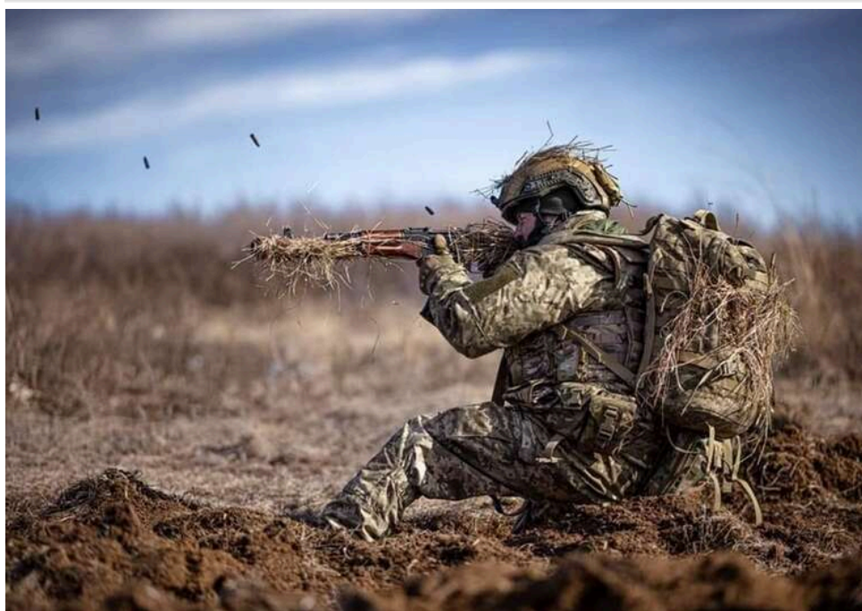
Ситуація на фронті: 138 боїв за добу, найважче на Покровському та Гуляйпільському напрямках

Розпочалася 1529-та доба широкомасштабної збройної агресії РФ проти України. Загалом протягом минулої доби зафіксовано 138 бойових зіткнень.