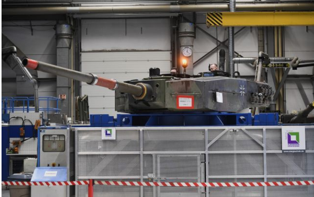
Фото: виробництво танків Leopard в Німеччині

Обирайте перевірене - додайте РБК-Україна до улюблених джерел у Google