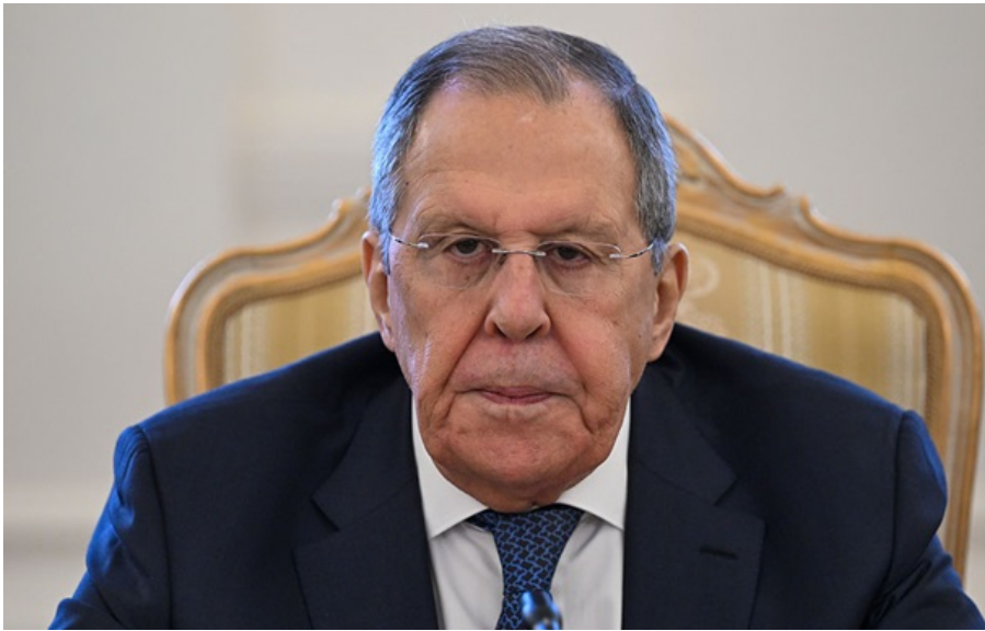
Сергій Лавров зробив заяву щодо переговорів зі США

Ініціатива створення нового військового блоку походить зі США та просувається спецпредставником Кітом Келлогом, заявив глава МЗС РФ.