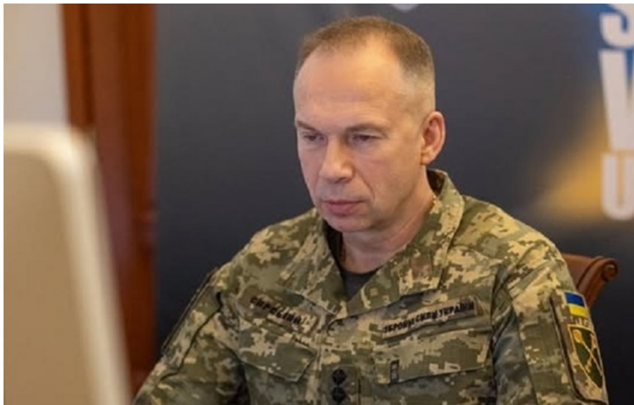
Головнокомандувач Збройних сил України Олександр Сирський

Обговорили питання щодо реалізації стратегії безпекових гарантій для України з боку держав-учасниць багатонаціональних сил у форматі Коаліції охочих.