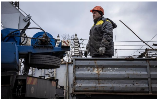
Фото: Працівники компанії ДТЕК відновлюють мережі після атак (Getty Images)

Обирайте перевірене - додайте РБК-Україна до улюблених джерел у Google