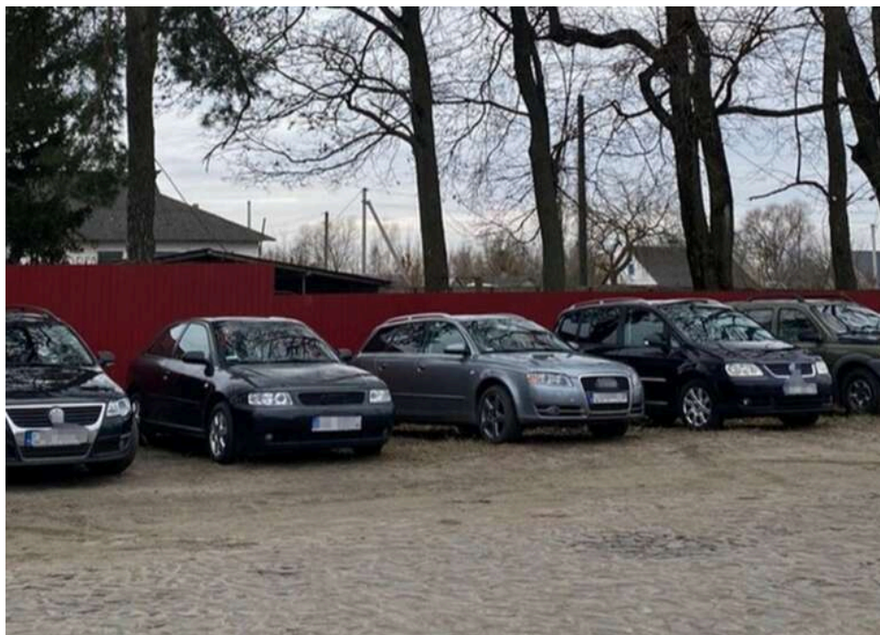
Бізнес на пільгах для ЗСУ: як перекупи продають гуманітарні авто під виглядом допомоги фронту

Схема з машинами для армії виглядає просто: авто завозять як гуманітарну допомогу, не платять розмитнення, оформляють на військовослужбовця чи фонд, отримують тимчасові документи – і продають. Формально – допомога фронту. По суті – ринок зі зрозумілою маржею.