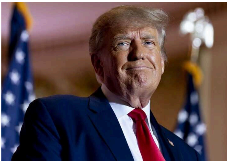
Трамп заговорив про скорочення військ у Німеччині одразу після розмови з Путіним, чим шокував Пентагон, - Politico

Оголошення президента США Дональда Трампа про те, що він розглядає можливість виведення частини американських військ із Німеччини, здивувало представників Пентагону, які почали з'ясовувати, чи серйозно глава Білого дому налаштований виконати свої погрози цього разу.