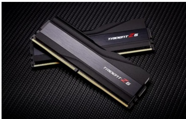
Ціни на DDR5 пам'ять почала потрохи знижуватися

Після різкого стрибка до €450 за 32 ГБ з'явилися перші ознаки корекції через слабший попит.