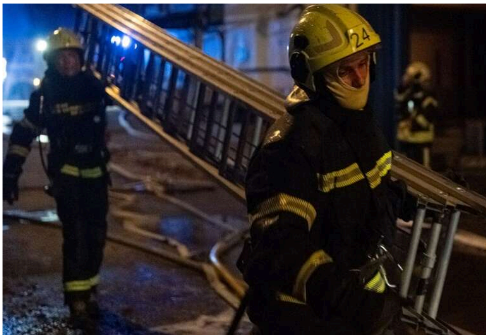
Харків під атакою дронів: «шахед» влучив у багатоповерхівку, є поранений

Російські безпілотники атакували Харків уночі 2 травня. Є влучання у житловий будинок, пошкоджені авто та поранений чоловік.