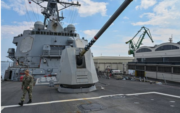
Фото: військовий корабель США

Обирайте перевірене - додайте РБК-Україна до улюблених джерел у Google